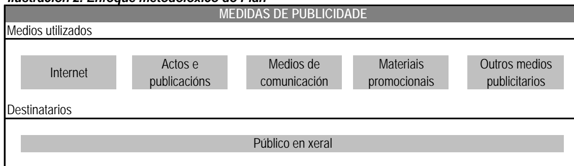
Ilustración 2. Enfoque metodolóxico do Plan

Para iso e co obxecto de aumentar a efectividade das accións de comunicación, estas organizaranse en torno a tres momentos temporais -a fase de lanzamento do Programa, logo da súa aprobación; a fase de execución das intervencións; e a fase de difusión dos resultados do Programa, unha vez finalizada a súa implementación - e levaranse a cabo a través de distintos medios, adaptados á finalidade perseguida en cada fase (ver Capítulo 2) e ás características específicas dos grupos destinatarios (ver Capítulo 3).